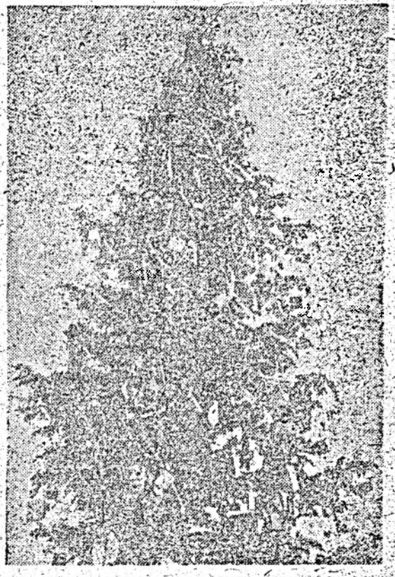
O brad frumos...