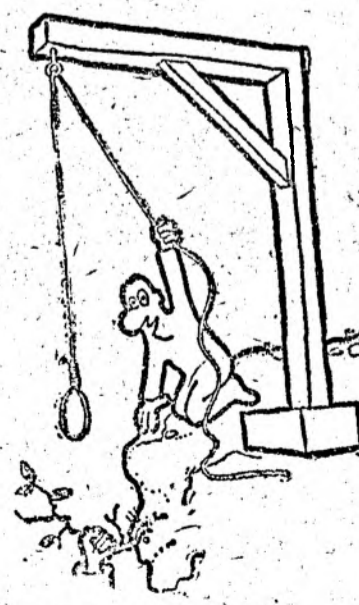
Desen de Mihai BACOCIU

La Palatul Cotroceni a avut loc luni, o nouă întîlnire — a doua — între președintele Ion Iliescu și o delegație a Partidu- lui Național Liberal, condusă de președintele acesteia, domnul Radu Câmpeanu.