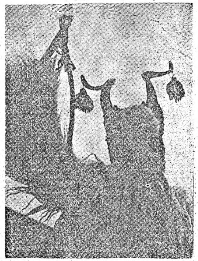
Mască din tradiționalele sărbători de iarnă