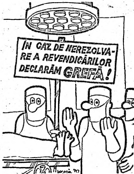
Desen de Mihail BACOCIU