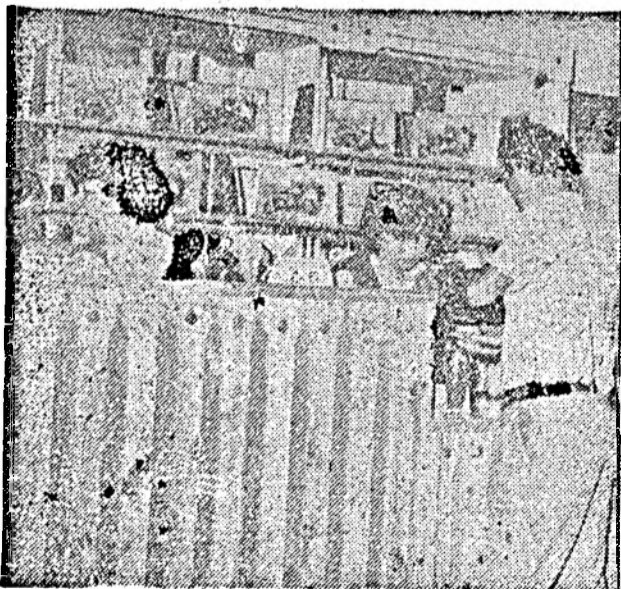
Două secvențe de la Cofetăria „PARC”

multă căutare și apreciere. Pe linia modernizărilor, am început lucrările la restaurantul „Potaissa”. Dorim ca turdenii, acești oameni harnici și pricepuți, să beneficieze, în scurt timp (asta depinde de I.G.C.L., care, din păcate, târăgănează încheierea lucrărilor) și de o unitate de alimentație publică cît mai modernă și funcțională. Am modernizat și alte unități cum ar fi Cafe-Barul și Pensiunea din cartierul Opișani, și, în viitorul apropiat, vom deschide o nouă unitate modernă într-un local nou: Rotiseria-Pizzerie din centrul civic al municipiului.