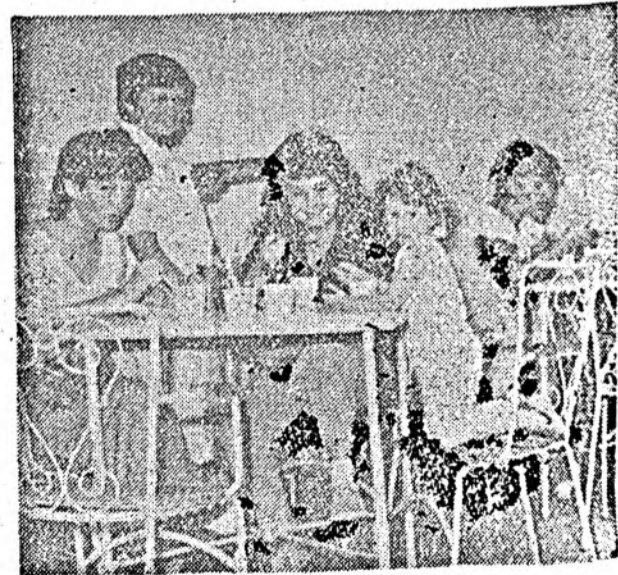
Grădina de vară „Patiserie”

— Promițător și optimist. Această previziune se degajă din largă deschidere pe care am avut-o și o avem față de înaintarea, cu pași fermi, spre economia de piață. Dealtfel, avînd în vedere tot mai satisfacerea în cel mai înalt grad a cerințelor consumatorilor cu cele necesare traiului, vom pedala și în viitor pe ideea cuprinderii unităților noastre, cu mare pondere în desfacere, în societate comercială, capabile să răspundă acestor desiderate. În ce privește unitățile mai mici, de asemenea, dacă ele nu vor satisface cerințele impuse de noile exigențe, firește că vom fi de acord ca și ele să fie privatizate. Spre a leși din chingile unei economii excesiv centralizate, care ne-a adus atîtea necazuri în aprovizionare și desfacere, întreaga noastră economie națională se îndreaptă acum cu pași fermi spre economia de piață. Noi fiind o parte din ea, firește, nu vom bate pasul pe loc!