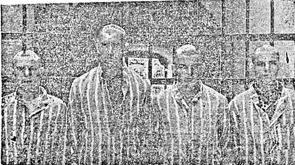
Patru nemernici au atenat la pudoarea unei fete. Probabil, va fi traumatizată pe viață

Cam atît despre copii. Noroc că niciunul dintre evenimente nu s-a soldat cu victime. Nu uitați însă: CIRCULAȚI CU ATENȚIE! E SPRE BINELE NOSTRU, AL TUTUROR.