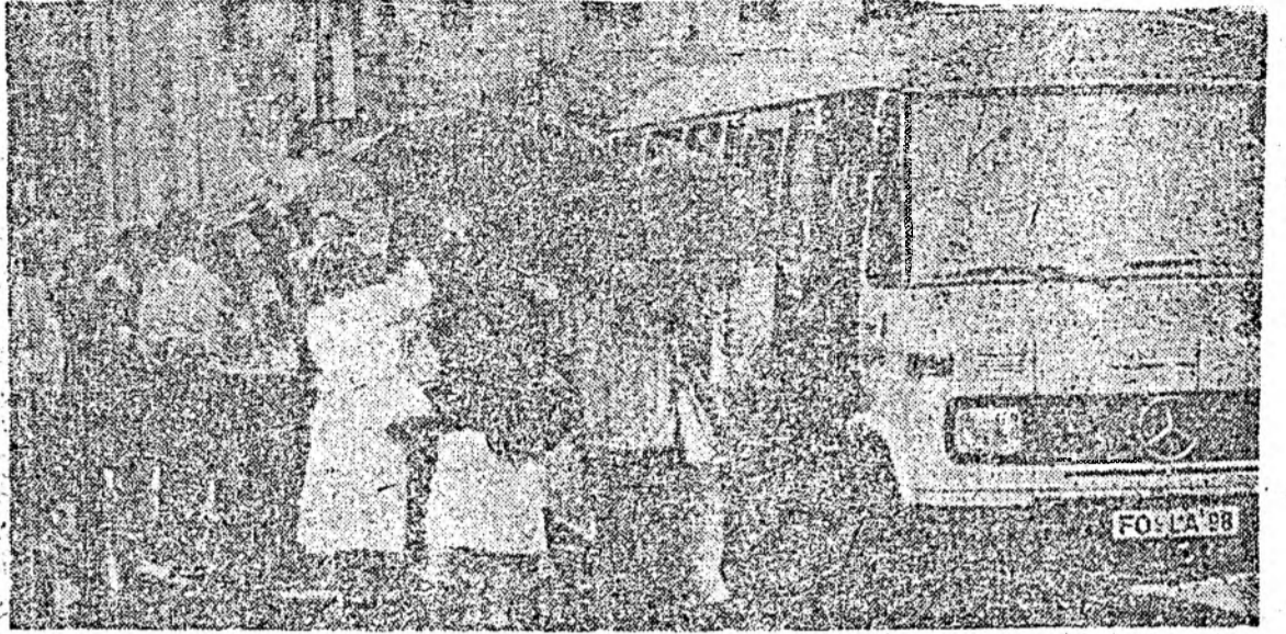
21 de copii români au plecat pentru a-și petrece vacanța în R.F.G.

ea ar urma să trăiască și să se pregătească, în deplină siguranță, toți cei care militază pentru un altfel din interior. Desigur că în fruntea ei va fi numită persoana cea mai agreată de pieșarii clujești. Și aceasta nu pentru că numele ei, netrecut în bulcin, are puternice rezonanțe istorice, ci pentru că este capabilă, cum a demonstrat în ultimele 7 luni, de performanțe ieșite din comun în pregătirea gulașului. D-l prefect mi-a vorbit și de alte intenții laudabile, promiștoare, chiar, domnia sa erătîndu-se dispus la orice sacrificii pentru cauza celui mai nou și mai pur Forum local. Totuși un lucru i se pare peste putință. Și anume, de a-și lăsa plete, a le decolora și a-și face cărare pe mijloc. Și părinții domniei sale l-au îndemnat la acest gest măref, arătîndu-i că el este un obicei străvechi, purtător de noroc. Dovada? Ultimul li-