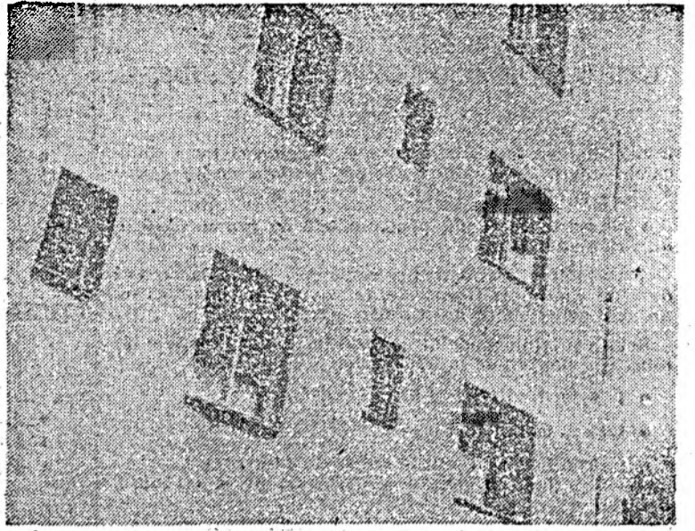
Acest bloc din Agheș Fabrici are 20 de apartamente. S-au cheltuit o groază de bani, apoi a fost evacuat pentru reparații. Sint ani de zile de cînd singurii locatari sînt șobolanii. Nu că nu se poate, dar nimeni nu vrea să facă nimic pentru remedierea situației