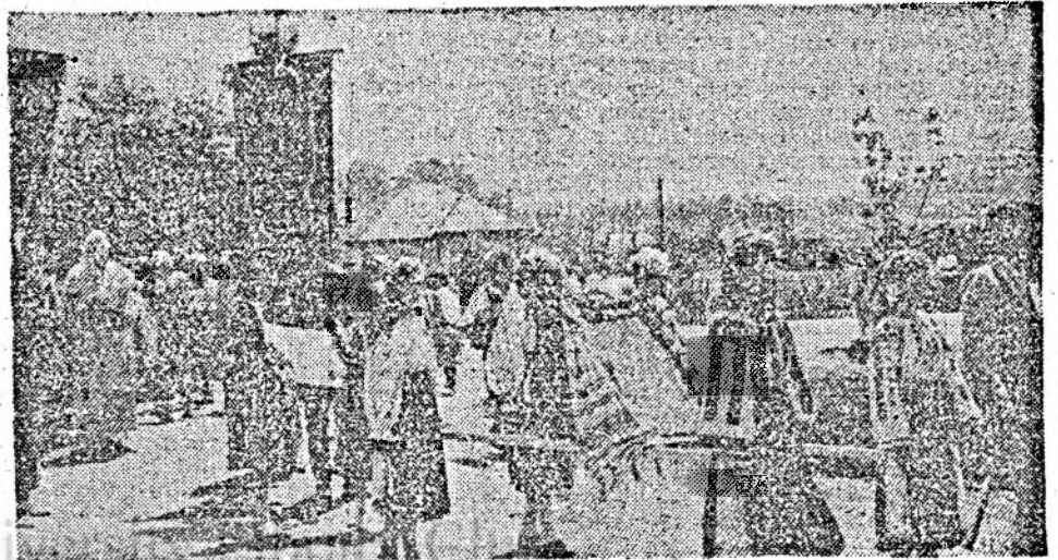
Din frumoasele obiceiuri populare românești

Conducerea muzicală: Emil Maxim, regia artistică: Viorel Gomboșiu, scenografia Gheorghe Codrea.