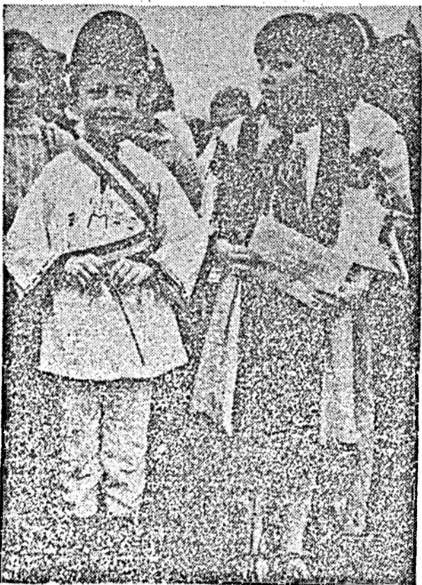
Copii la Blaj