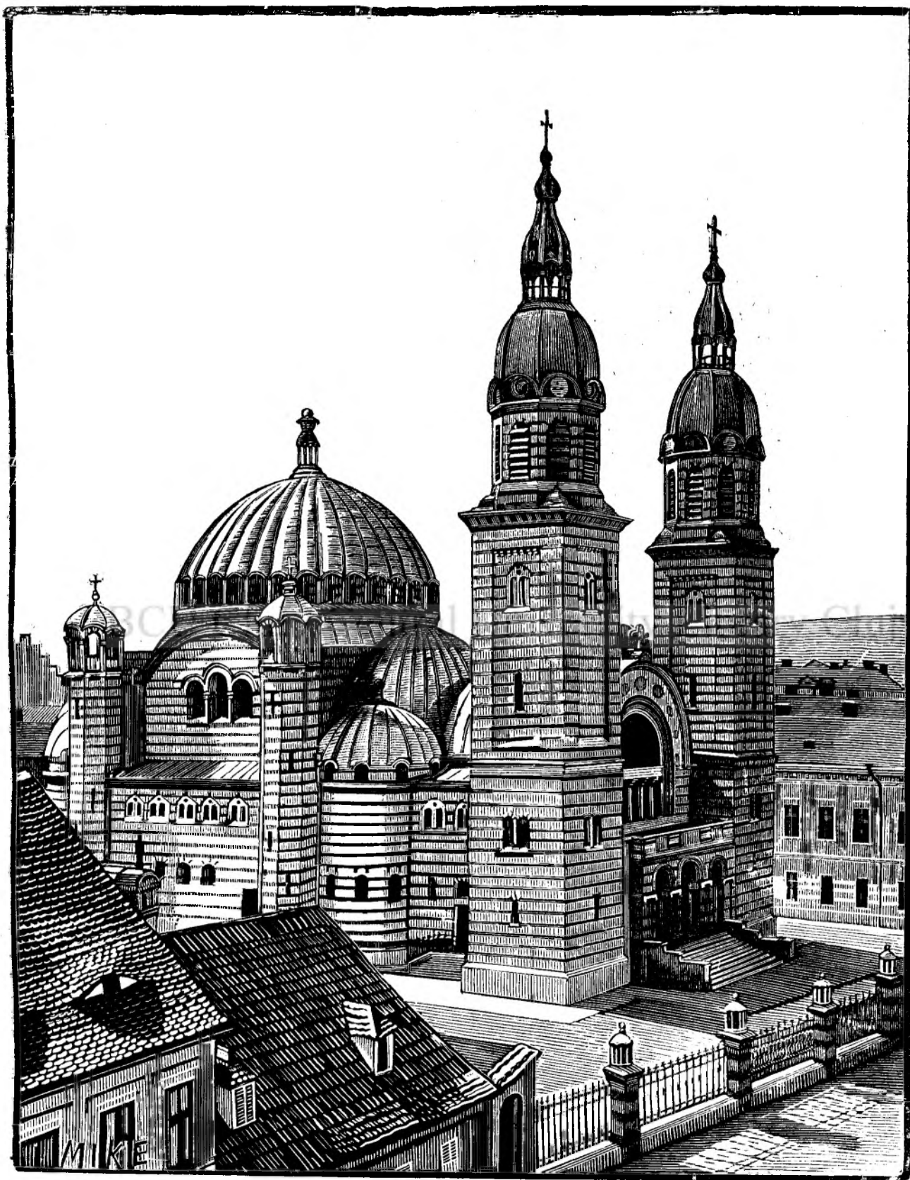
Catedrala gr. or. din Sibiu.