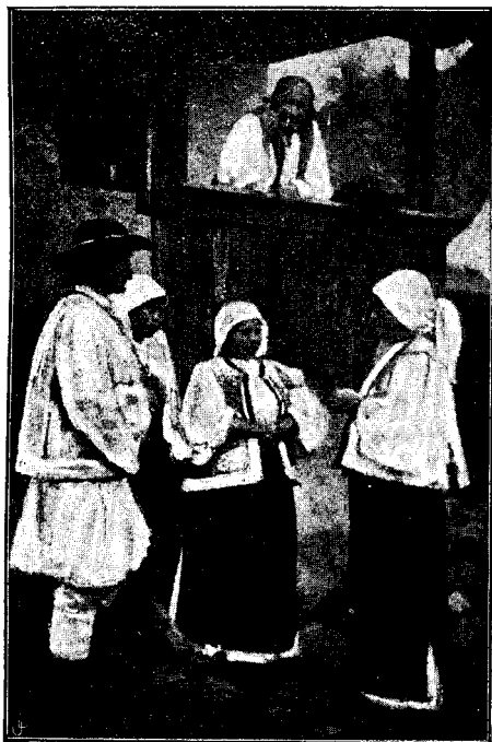
O grupă din Selște.