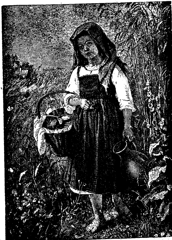
De prânz tătucului.

Se uită lung la geam. E noapte-afară, Și lună 'n cer ca ziua. Și-î târziu. Se uită 'n gîur prin colțuri, spre cămară... Și-apoi se 'ntoarce 'ncet spre ușă iară — Tăcere și pustiu.