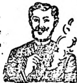
Pastilele lui Egger mă scapără iute.

Un carton 1 cor. și 2 cor. Carton de probă 50 fil.