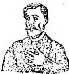
Afurisita de tusa mă ineacă.