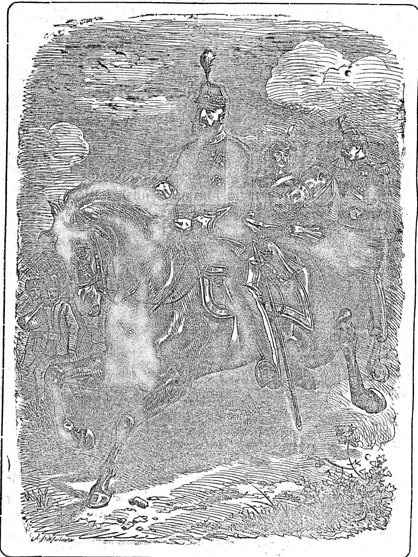
Am amintit, că săptămâna trecută viteazul și înțeleptul rege al fraților noștri din România a implinit 69 ani ai vârstei. Din acest prilej dăm portretul, care ne înfățișează pe rege călare, ca comandant al oastei, când era în floarea vârstei bărbătești.