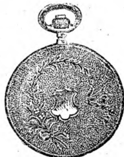
Nr. 2. Orologiu anker-remon. de argint, 50 mm. diametru, cu capac dublu, toc guiloșat ori gravat, 3 capace de argint, 5 rubine, sorte tari, I. fină Uraniawerk 15 rubine, fl. 12.50.