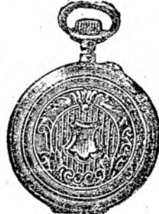
Nr. 7. Orologiu cilindru-remt. de argint nou, 48 mm. dia- metru, luciu ori gravat, în formă ovală, arătător de secunde, cu placă de cifre albă. emailată, I. calitate, fl. 4.50, cu capac dublu fl. 5.80. Lanțuri de nik- kel cu compas ori cheia 30, 40, 50, 60 cr.

Prospecte bogat ilustrate gratis și franco. Spedări cu rambursă ori pe lângă trimiterea înainte a prețului.