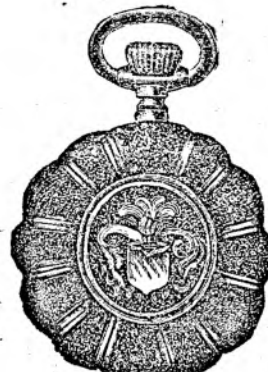
Nr. 6. Orologiu de dame, rem., de aur de 14 carate, 30 mm. dia- metru, capac dublu, I. calitate, guiloșat ori gravat fl. 25.—, în toc de argint fl. 11.50.