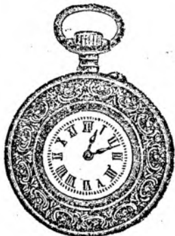
Nr. 3. Orologiu cilindru-rem. de argint, 48 mm. diametru, cu placă de cifre în email albă ori colorată cu toartă ovală, arătător de secunde, construcție bună so- lidă, fl. 6.75.