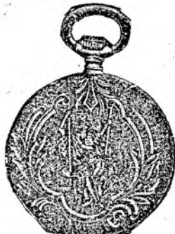
Nr. 5. Orologiu anker-remon. de argint, 50 mm. diametru, capac dublu, 3 capace de argint, 15 ru- bine, cu cerc de aur, fabricat fin, din sorte mai tari fl. 11.50, cu construcție cil.-rem. fl. 9.50.