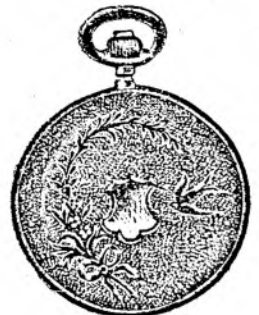
Nr. 2. Orologiu anker-remon. de argint, 50 mm. diametru, cu capac dublu, toc guiloșat ori gravat, 3 capace de argint, 5 rubine, sorte tari, I. fină »Urania« 15 rubine, fl. 12.50.