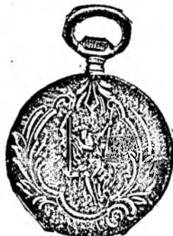
Nr. 5. Orologiu anker-remon. de argint, 50 mm. diametru, capac dublu, 3 capace de argint, 15 rubine, cu cerc de aur, fabricat sin, din sorte mai tari fl. 11.50, cu construcție cil.-rem. fl. 9.50.