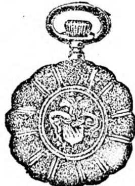
Nr. 6. Orologiu de dame, rem., de aur de 14 oarate, 30 mm. diametru, capac dublu, I. calitate, guiloșat ori gravat fl. 25.—, în toc de argint fl. 11.50.