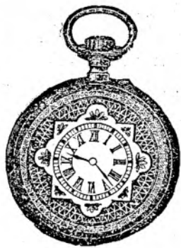
Nr. 1. Orologiu de argint remon-toir, pentru dame; 30 mm. diametru, cu capac de argint, calitate bună fl. 8.75, cu cerc de aur fl. 7.50, de oțel negru oxidat fl. 6.50.

Reparaturi de tot soiul se eșeută bine și conștiențios.