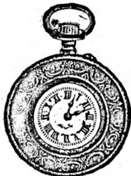
Nr. 3. Orologiu cilindru-rem. de argint, 48 mm. diametru, cu placă de cifre în email albă ori colorată cu toartă ovală, arătător de secunde, construcție bună solidă, fl. 8.75.