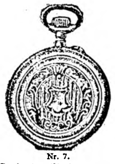
Nr. 7. Orologiu cilindru-rem. de argint nou, 48 mm. diametru, luciu ori gravat, în formă ovală, arătător de secunde, cu placă de cifre albă, emailată, I. calitate, fl. 4.50, cu capac dublu fl. 5.80. Lanțuri de nikkel cu compas ori chei 30, 40, 50, 60 cr.

Prospecte bogat ilustrate gratis și franco. Spedări cu rambursă ori pe lângă trimiterea înainte a prețului.