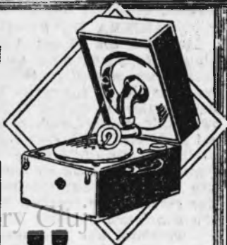
Ap. Tip N°40

AU PRODUS SENSAȚIE ÎN TOATĂ LUMEA DATORITĂ PERFECTIONĂRII DESĂVÂRSITĂ FIIND CONSTRUITE DUPĂ NOII PRINCIPII PE BAZA RADIOELECTRICITĂȚII