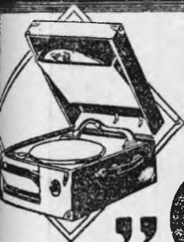
Ap. Tip N°45

— Să vezi ce a fost. Nevastă-mea, a găsit pe stradă o botniță și cum este econoamă, nevoe mare, m'a silit să-i cumpăr un câine, ca să albe ce face cu ea.