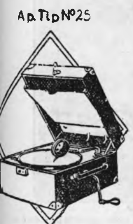
Ap. Tip N°25

AU PRODUS SENSAȚIE ÎN TOATĂ LUMEA DATORITĂ PERFECTIONĂRII DESĂVÂRSITĂ FIIND CONSTRUITE DUPĂ NOII PRINCIPII PE BAZA RADIOELECTRICITĂȚII