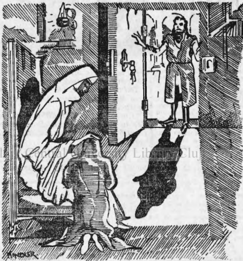
Când boer Eremia intră în arhondărie, găsi pe maica Porfirina, îngenuchiată înaintea stăreței Minodora.

„De ce-au făcut-o să sufere pe biata copilă, neprihănită floare de crin? Dar eu, eu de ce-am făcut pe atâția să sufere?!