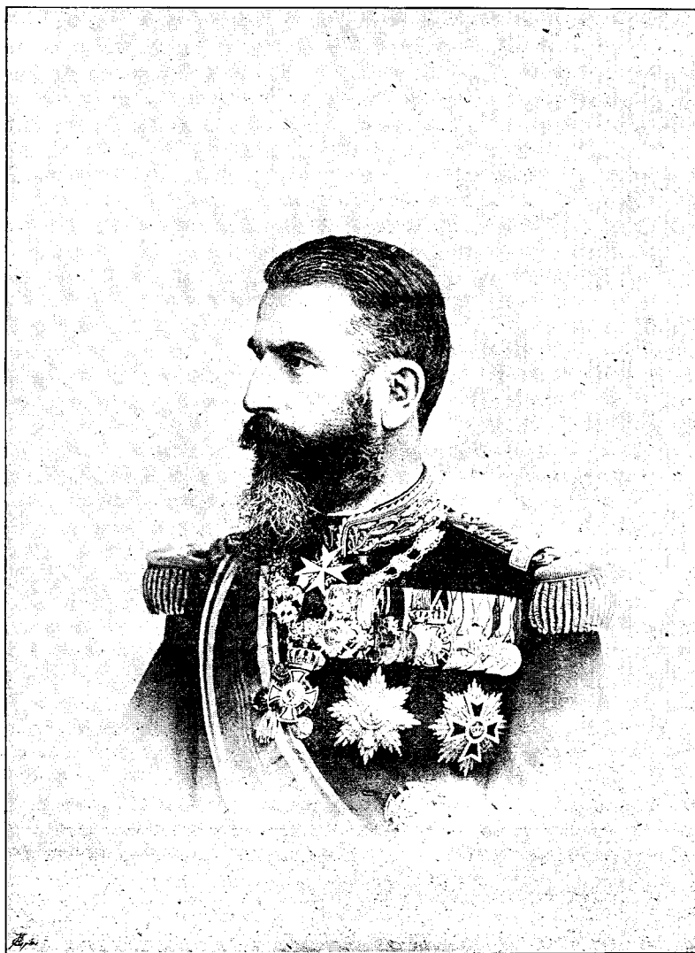
Carol I. Regele României.