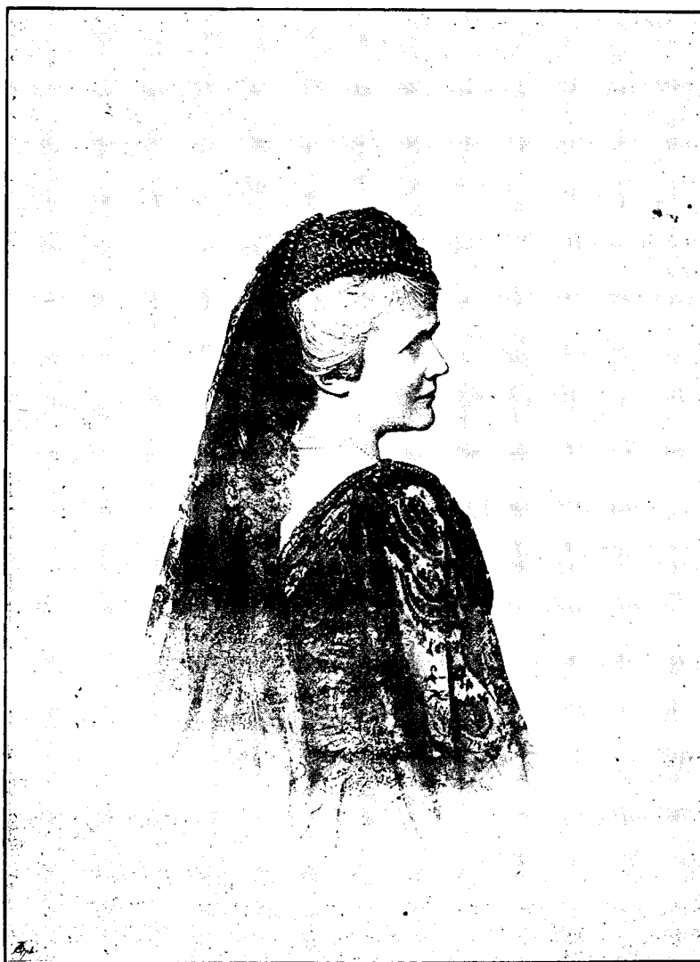
Elisaveta, Regina României.

lucrări însă, prin multe încercări, prin grele suferințe au trebuit s[ă] treacă cele două principate Moldova și Valachia, căci, „oarba neunire“, a „pismei răutate“, a vecinilor nesățioasă poftă de cucerire, a semilunei urgie și trufie și a Domnilor deasă schimbare și nestatornicie, multă nefericire au adus asupra lor, mult sânge le-au silit s[ă] verse pentru interese meschine și pe timp îndelungat le-au făcut s[ă] uite de a lor istorică menire. Mai ales însă îndelungata și rușinoasa domnire străină a grecilor fanarioți, demoralizați și demoralizatori, lipsiți de aspirațiuni ideale, generoase naționale, politice și culturale, și omoritori ai acestor aspirațiuni la poporul, ce fusese