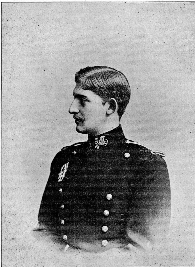
Ferdinand, presumptivul moștenitor al tronului României.

Dar' toate aceste eminente calități, cu care primul rege a înfrumșetă tronul țerii fraților nostri, n'ar fi ajuns sè realizeze pe deplin dorul aprins al divanurilor ad hoc de odinioară și legitimele așteptări ale țerei, care stabilitate voiau să aibă: „pentru-că dese schimbări ale Domnilor au împedecat propășirea morală și materială, ba chiar și neatîrnarea guvernelor Principatelor, și pentru-că numai moștenirea dă stabilitate“.