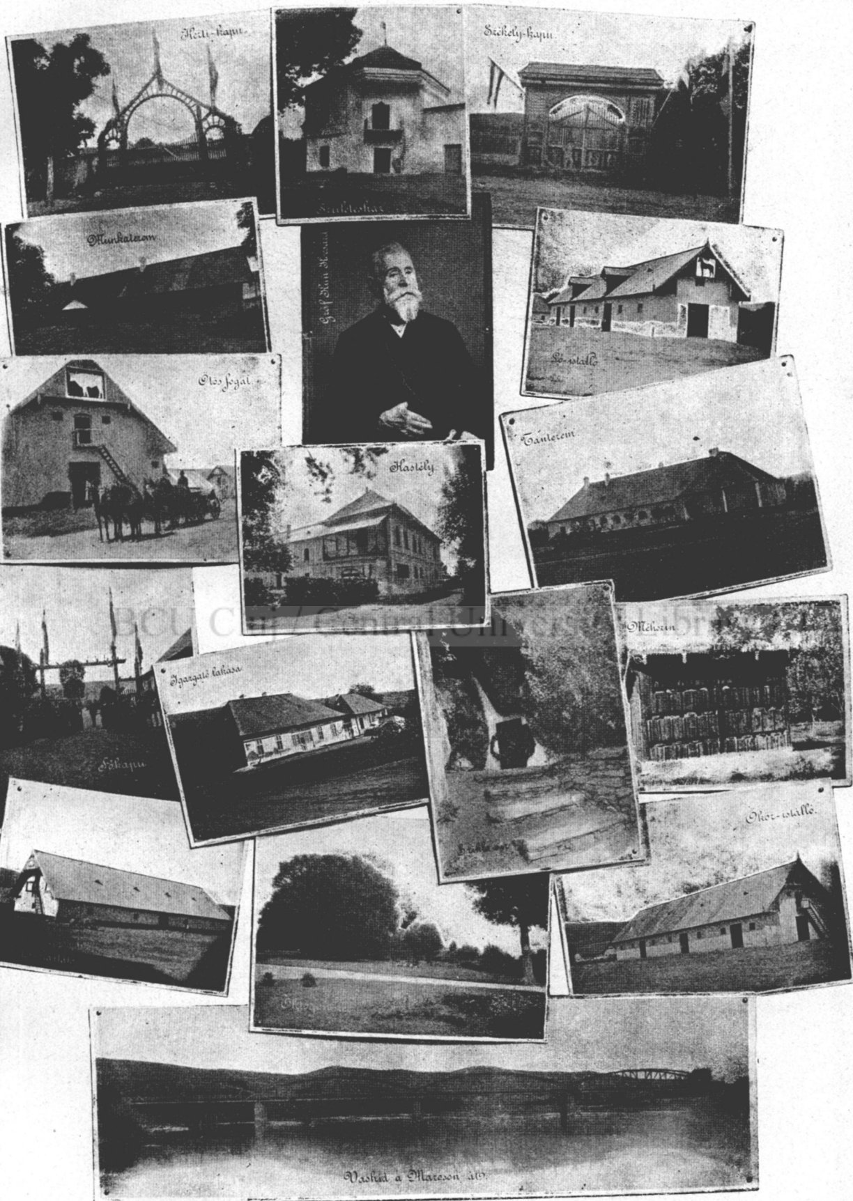
Képek az algyógyi gróf Kun Kocsárd székely földműves iskoláról.