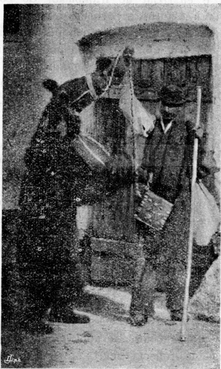
Joacă bine Niculae!

Eu am dat din cap, și mi-am întors capul spre părete. În ziua următoare, medicul — banul meu prieten mă cercetă și când mă văzu deștept îmi întinse mâna și: „ai scăpat” îmi șopti apoi surizind. M'am silit să i răspund prin un suris, dar — pareă acum ved, — n'am putut nici să-mi mișc buzele. Pare că n'am ris de când sunt. Eu care deși eram pururea în luptă cu necasul, totuși eram vial, căci eram obișnuit cu el, — și apoi dacă te dedai odată cu necasul și