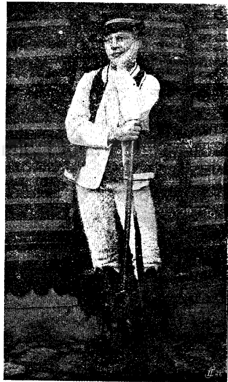
Un vinător din Bucium-șasa

Lipsa de aceasta cultură universală, neo-orientare în privința ideilor mari humanitare, a curentelor filosofice și literare: iată cauza pentru care mulți, aproape toți scriitorii noștri tineri nu o duc mai departe, decât la câteva ver-