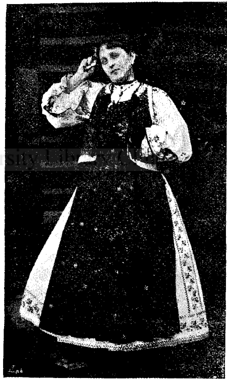
O nevestă din Bucium.

— De așa lungă vreme? În timpul ăsta trei oameni m'au vizitat la mormint... m'au supărat grozav, lua-i-ar dracul. Unul simplamente a tras la îndoială