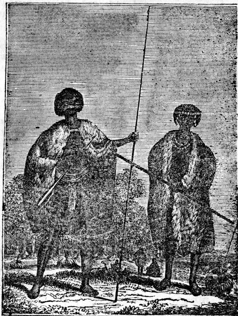
ИЖВІТОРІІ ТІН ОЛЛАНДІА НОВА.