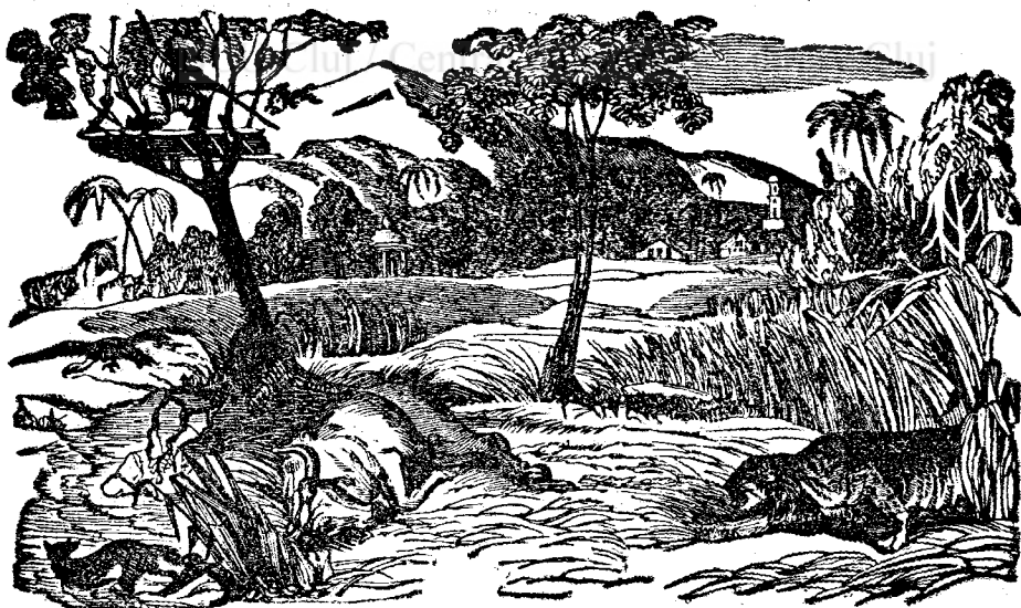
В ж н а т ѡ л ѡ н ѡ Т і г р і с д е п р е о Ф o p m ѡ з д е л к е п е д е .

с т а н с ж н т Т і г р і і . В у р о п ѣ н ѡ л , к а р е л е с з к з л а т о р ѣ щ е н ѡ м а і в р ѡ к ѡ ц ѡ в а д н і д ѡ п з а ч е с т В л д o p a d o а л с z ѡ , ш і д е а к о л o , д а к з а p e п a p т e ш і н o p o ч і p e , c z л т o a p ч e к з