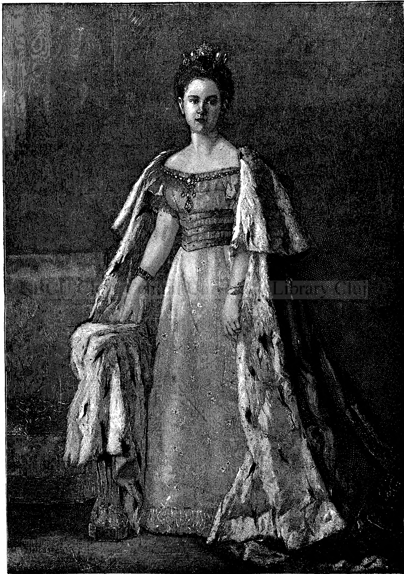
Wilhelmina regina Holandiei în gala de încoronare.