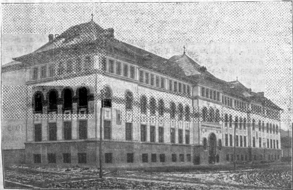
Școala normală de băieți

În mijlocul acestor cetățui ale pasiunilor ale distrămării, se ridică, senină și luminoasă Cetatea adevărului, Biserica universală a lui Hristos. Conștie de menirea-l dumnezească, arată tuturor drumul drept al mântuirii: deschide larg brațele, să cuprindă la sânul său de mamă pe toți filii luminii, fără deosebire de rang și de neam. Primește, binecuvintează și pune în aplicare orice gând bun, orice inițiativă.