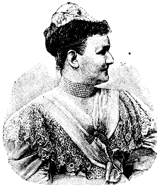
CAROLA REGINA SAXONIEI.

Și despre aceste stări ale copilăriei unei drame dați-mi voie să ve vorbesc, arătându-vi-o din fașe, adecă din momentul când autorul scrie „cortina cade“ după actul din urmă, până când ea pășește înaintea publicului pentru de a fi aplaudată sau huiduită. Nu voi face nici teoria dramei, nici nu ve voi conduce la prima reprezentație, ci voi cercă să ve introduc în misterele scenei, dând puțin culisele la o