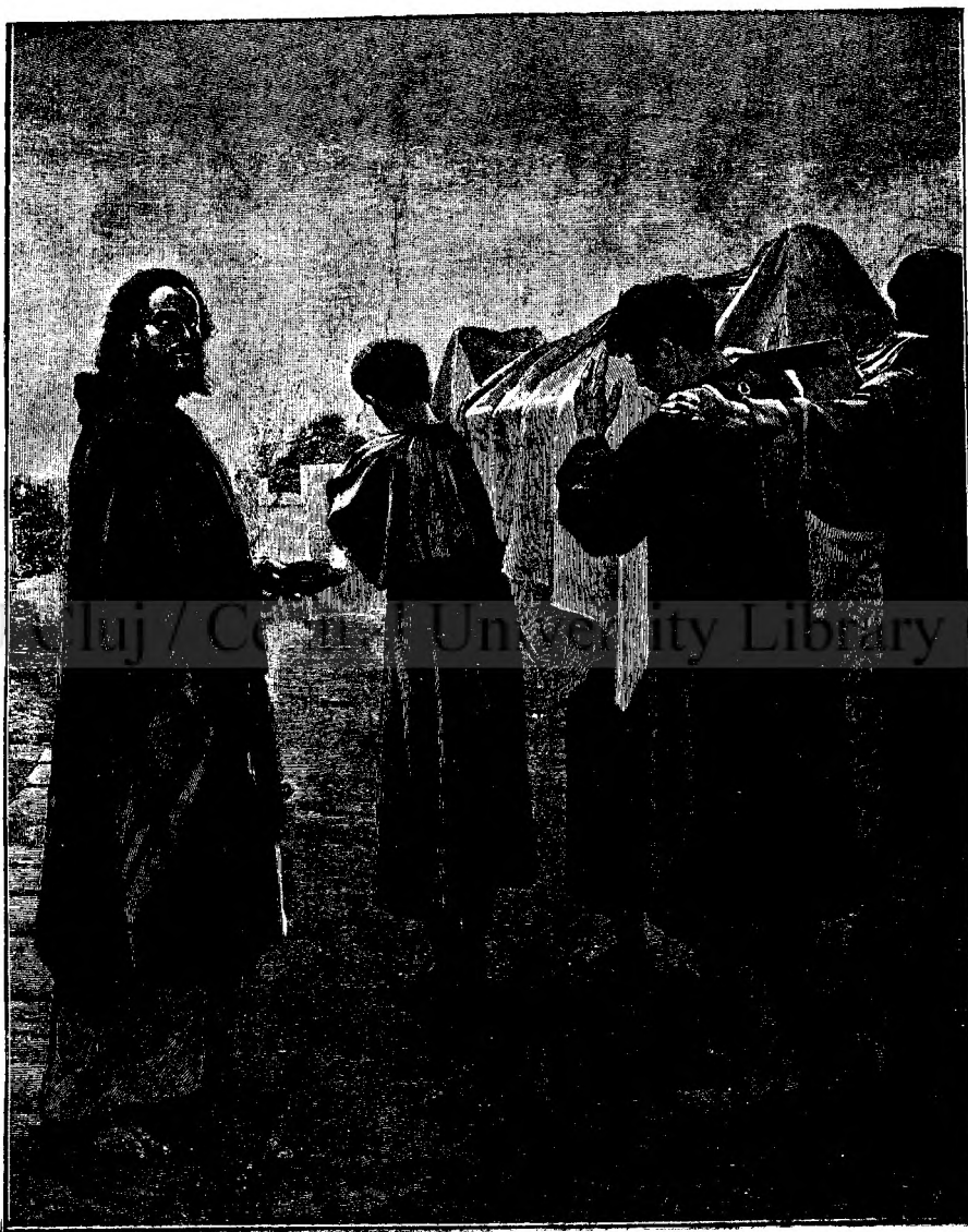
O înmormântare la Romani.

cel mai sărac în idei este al lui Alexandri, cel mai bogat al lui Mureșianu. Acesta e și cel mai limpede în concepțiune. Și pe când celelalte sînt unilaterale