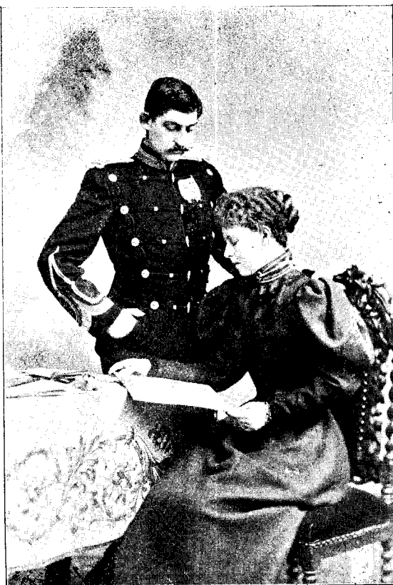
Principele Ferdinand și principesa Maria de România.

Aș! pe traiu! când nu ți-ai sfērșit de crestāt rebōjele datorilor cātră einstita muere!... Numai ce-l imflarā pe bietul Ion de la vatra unde, intr'o bunā diminēță, Acsinia pusese să se sfādēscă intr'o ôlă, la clocot, niște dragi de sārmluțe cu carne de mascur, și unde mi-l duseră la comisia de recrutare și unde mi-l desbrăcară, — să nu ve fie cu bănat — gol-golișor, cum l'a făcut maică-sa... Și