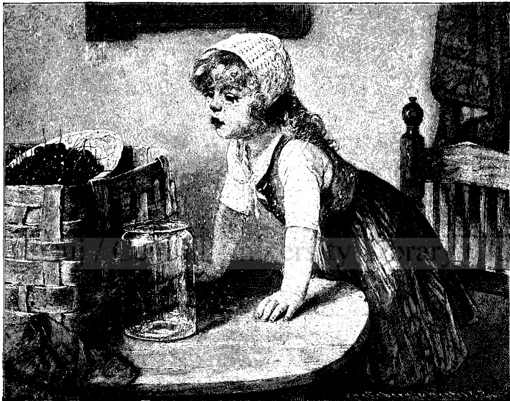
ÓRE CE ESTE IN LĂUNTRU?

Aveva par că vîețá dând! . . . Și dusu-s'au, așá, s'au dus Pân' la cămara cea de sus, Din vârful naltului castel, Cu uși și ziduri de oțel. Acolo grabnic i-a făcut, De catifea, un așternut, La cap cu perine de fir, Ca pentr'un nobil musafir Și i-a adus bogat ospēț Cu demâncări de mare preț Și cu vinațuri pe porunci; Căci șórecii de pe atunci, Precum poveștile ne spun, Iubiau paharul cu vin bun.