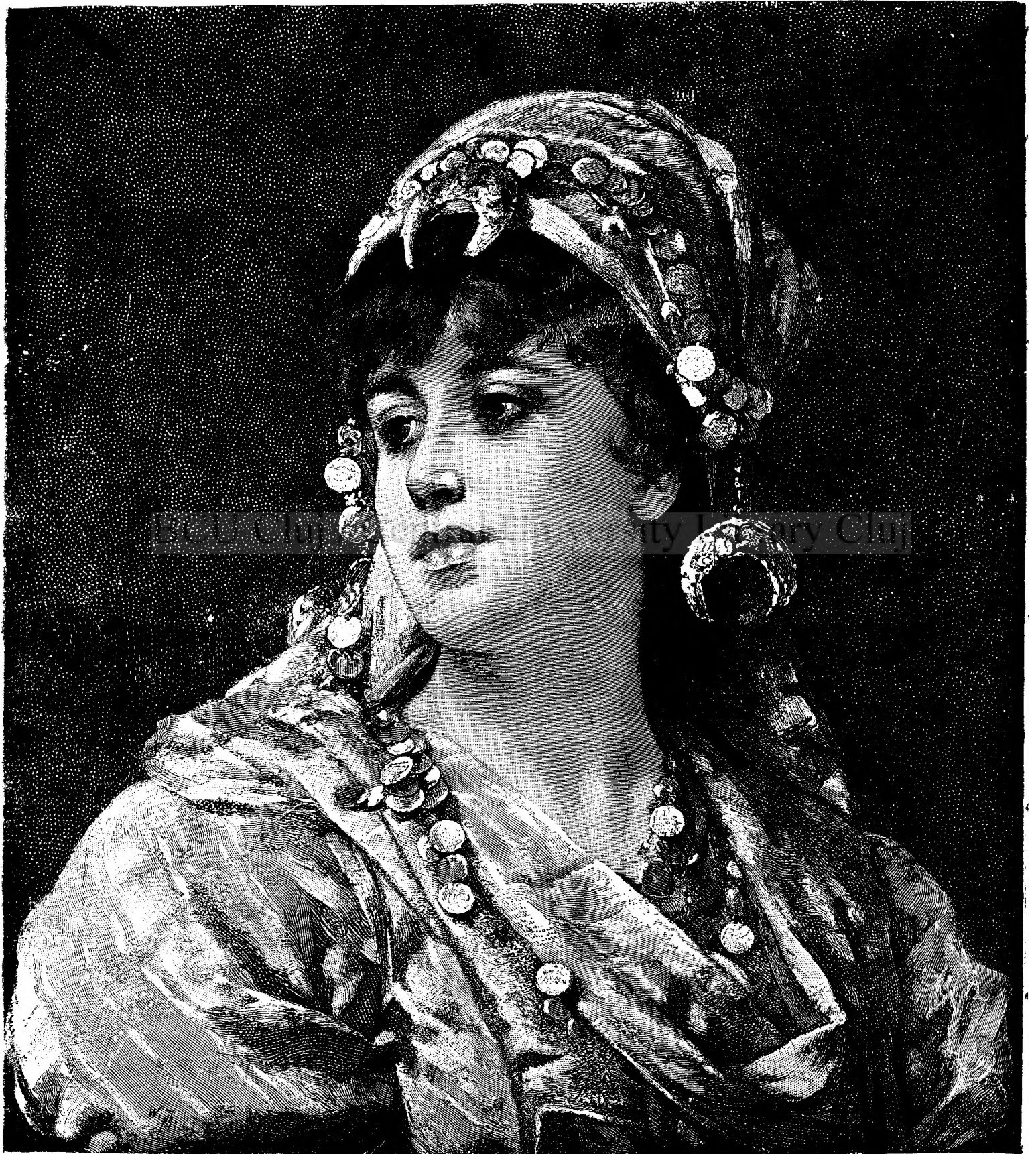
O frumusețe din Orient.