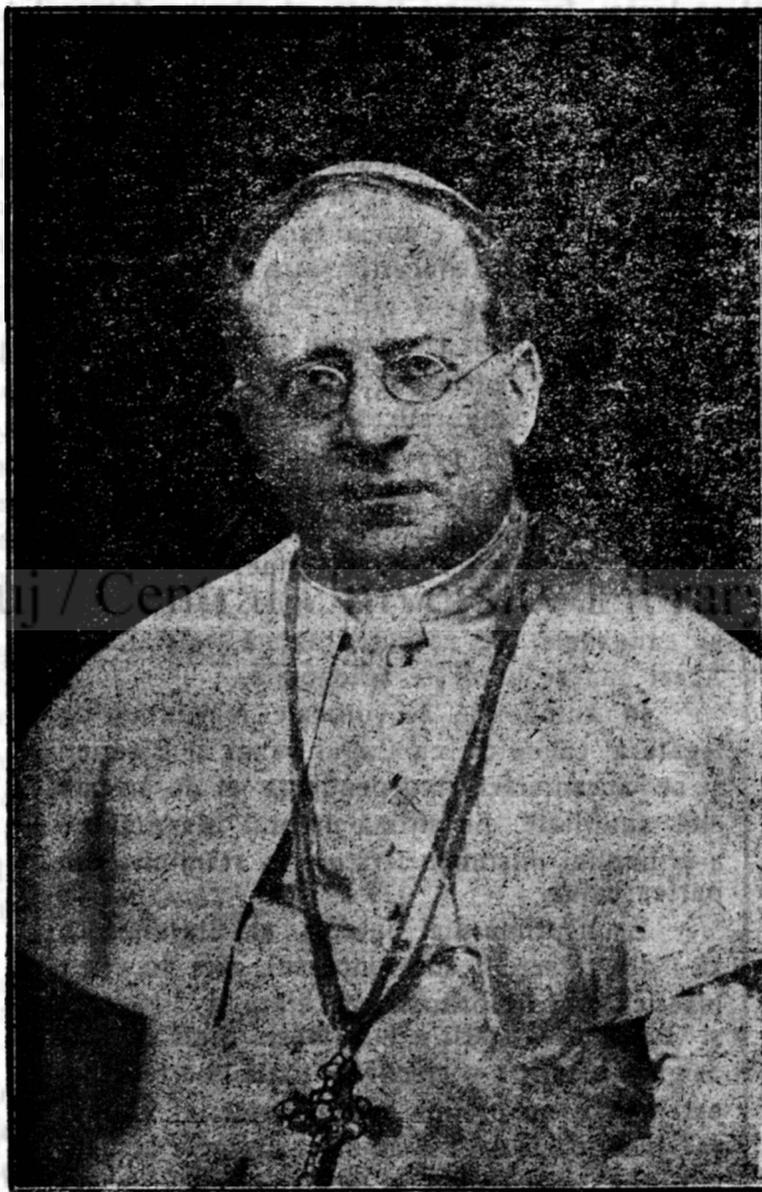
PAPA PIUS AL XI-LEA.

„Admirabil se potrivesc — spune sf. Părinte — acestor vremi cuvintele profetilor: „Așteptat am pace și nu era nimic bun; vremea vindecării și iată era spaimă” (Ier. 8, 15). „Vreme de vindecare, și iată turburare” (Ier.