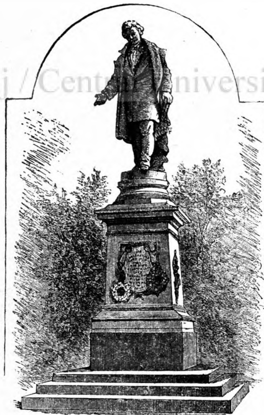
Statua lui Heliade in Bucuresti.

— Ba da, a fost unul Ilie. De felul lui erá vē- nător. Se spune că umblând el intr'o đi aşá cu frate- seu, prin munţi, s'a rēşleţit unul de altul. De unde şi până unde pe Ilie l'a prins un somn: cădea d'a'npí- ciórele, nu alta. De, se đice că el se tot rugá mereu la Dumnezeu să-i arate o comóră. S'a culcat Ilie, că