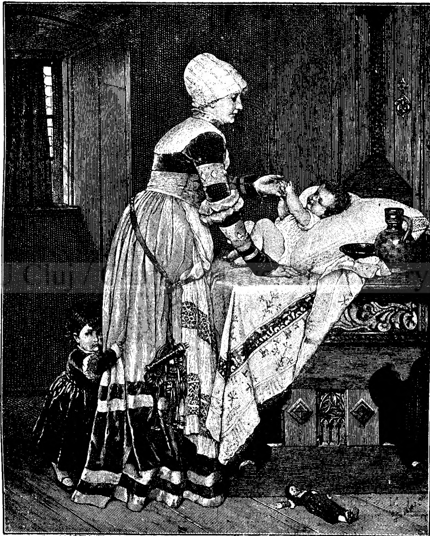
CEL MAI MIC.