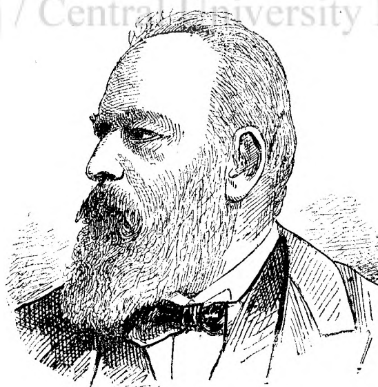
DR. TEODOR BILROTH.

În adevăr, Iași după strălucitul Paris, după monumentală Florență, părea cu adevărat un oraș oriental, alcătuit, cum dice poetul, din «o mulțime de hardughii vechi, nalte, strîmbe, mucedu, cu păreții afumați și crepați, cu ferestrele mici și chióre, cu streșinele putrede și ascuțite, cu scările întunecate, cu ogrădile pline de burueni selbatice și cu ziduri gróse prin pregiur. Locuințele păreau cuiburi de bufne, locuinți de stafii ce te infiorează și unde ți se pare că veđi zăcend câte un matuf gârbov cu ghigilie pu frunte, cu metanii în mână, care horcăeșce, ocărind necontenit câteva țigance sdrențeróse ce stau dinaintea