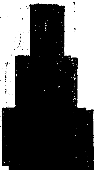
Țigla Bohn de Nagyikinda.