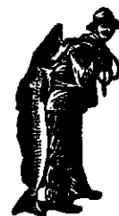
La cumpărarea Emulziei, luați sama să aibă marca de scutire alui Scott: Pescarul

și alte îmbolnăviri ale organului de respirație de cari să pot îmbolnăvi tineri și bătrâni, să ușurează lesne prin Emulziunea-SCOTT. Deja câteva doze ajung, pentru-ca ori-cine să se convingă despre aceasta. Efectul miraculos al