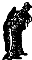
La cumpărarea Emulziei, luaţi amănunţit să vă uitaţi la marca de scutire alui Scott: Pescarul

e uşa secretă, prin care intră toate boalele serioase în corpul omenesc. Emulziunea SCOTT, compoziţie de oleu de ficat de peşte e însă cheia care închide această uşe, încă înainte de a să apropia boala de ea!