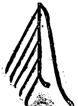
Nicovale, forma, fig. 2 3 1 bucată C. —96 —86