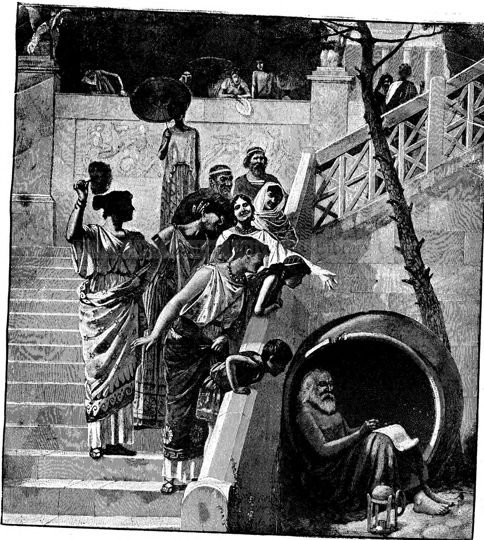
D i o g e n e .