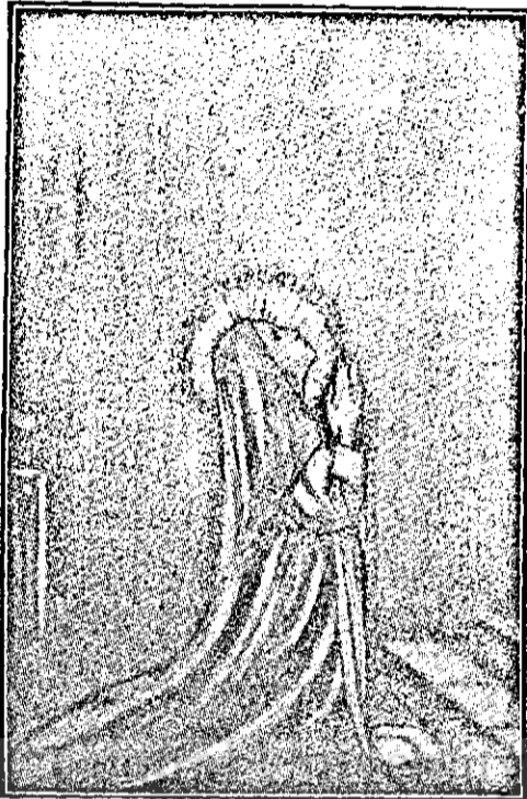
Tilufa în rugăciune

stră. Otilia nu s'a mai abătut de pe calea pe care pornise Tilufa. Dimpotrivă: s'a ostenit mereu și a urcat nelncetat pe ca-