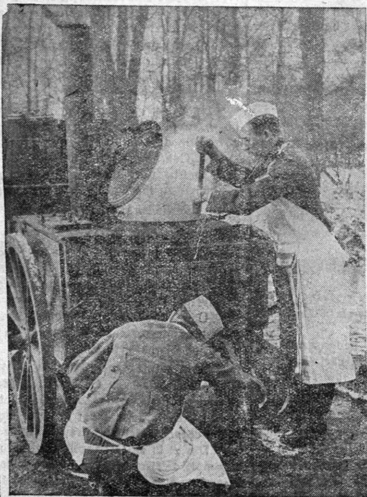
O bucătărie germană pe front