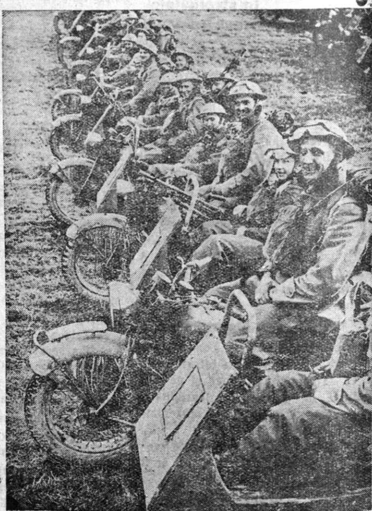
Soldați motocicliști englezi plecând la luptă