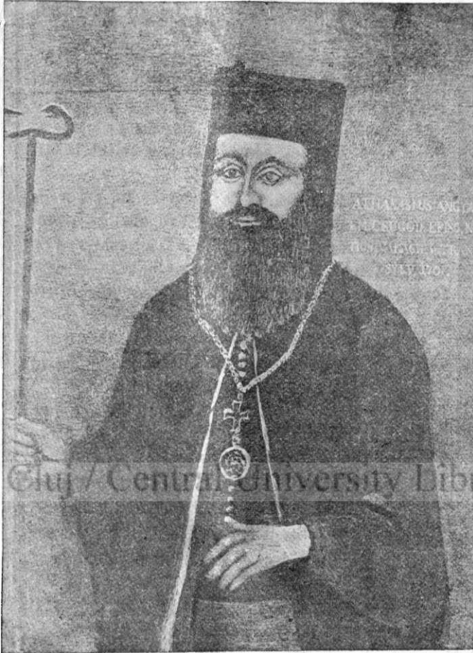
Episcopul Atanasie Anghel, înfăptuitorul unirii cu Roma

La 25 Ianie același an, se făcu instalarea lui Atanasie întru episcop, cu atâta pompă și solemnitate, cum nu se mai văzuse până atunci