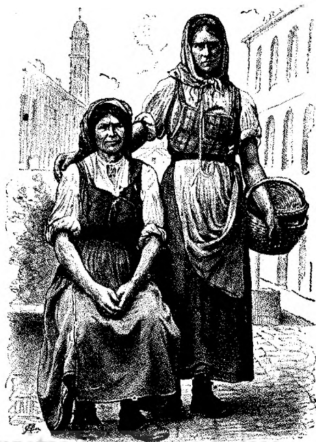
TIPURI DE SERVITORE DE PELA ZADAR.