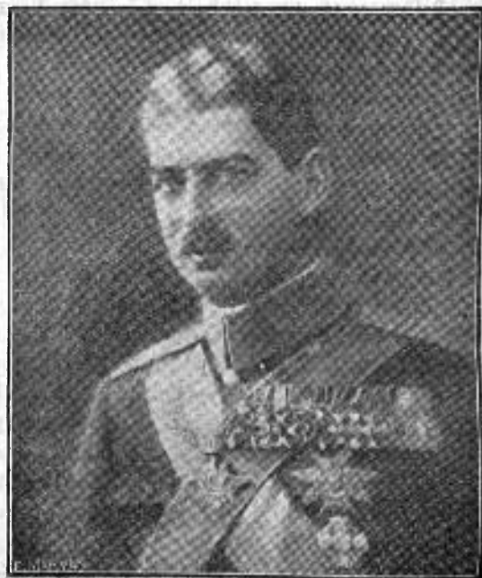
M. S. Regele Carol al II-lea

Cum va fi întocmită săptămâna cărții. „Fundațiile Culturale Regale“ ne-au trimis un program al „săptămânei cărții“. În această săptămână, care începe în 12 Maiu, toate librăriile vor fi împodobite cu cărți românești. În toate centrele se vor ține șezători și conferințe asupra comorilor literaturii noastre. Se vor înființa biblioteci unde nu sunt și se vor mări acelea cari sunt. Săptămâna cărții va fi mărturia dragostei de carte a neamului românesc în ochii străinilor, și de aceea, pentru lumea reușită a ei, fiecare are datoria să se trudească.