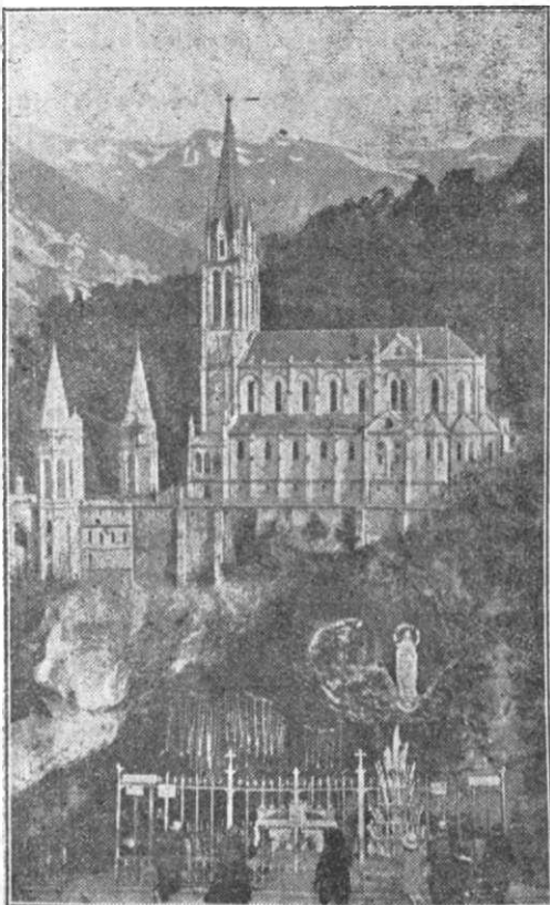
Alături de peștera un de Cea plină de dar s'a arătat Bernadeta, s'a înălțat o măreață biserică.

Rădăcinile plantelor cultivate ca îngrășăminte verzi sunt lungi, încât ajung în partea de jos a pământului, de unde își sug hrana care a fost dusă acolo de către apă. Hrana aceasta nu putea fi luată de