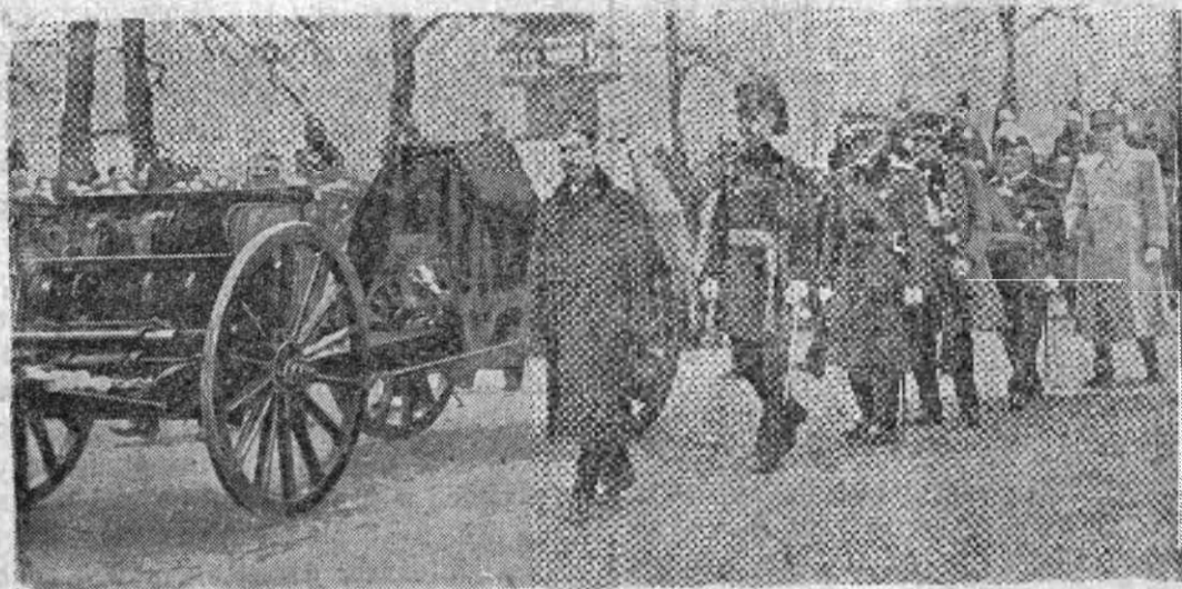
Chipul nostru înfățișează înmormântarea mareșalului Joffre. Siciul a fost așezat pe un afet de tun și acoperit cu treicolorul francez.