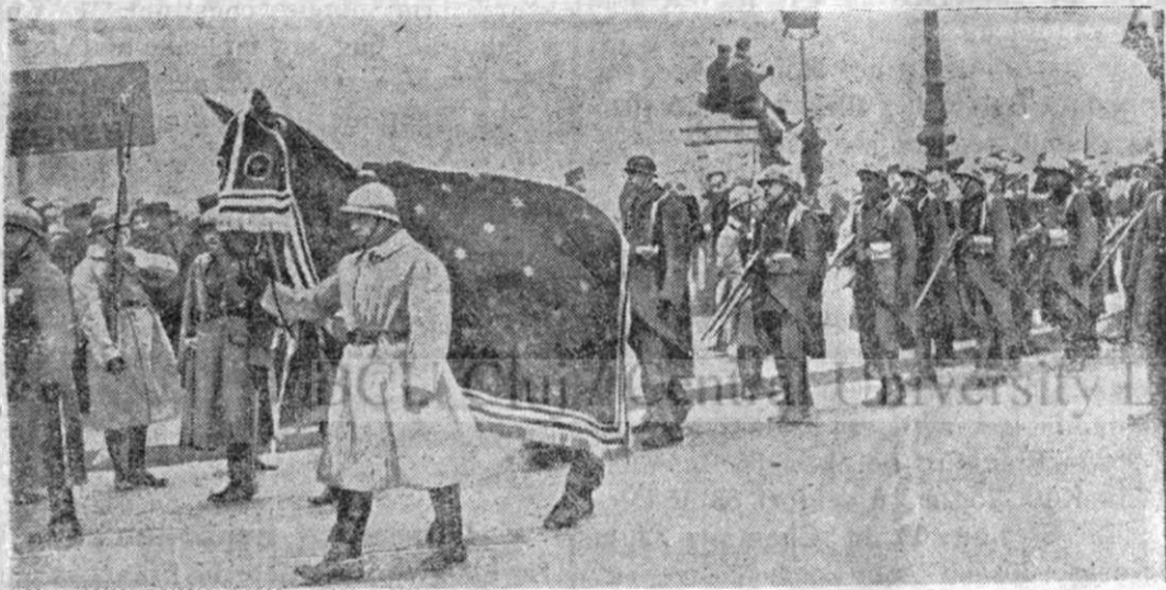
La înmormântarea mareșalului Joffre a fost purtat între jalnici și minunatul și credinciosul său cal, îmbrăcat în haină neagră. Muți oameni, văzându-l, nu și-au putut opri lacrimile.