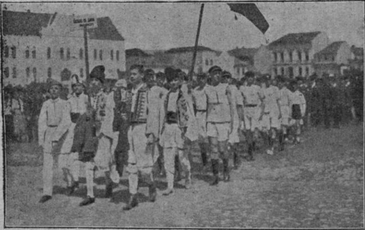
In valuri de lumină sosește tineretul.