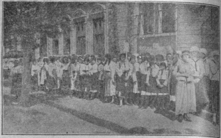
Măndre școlărițe în port național.