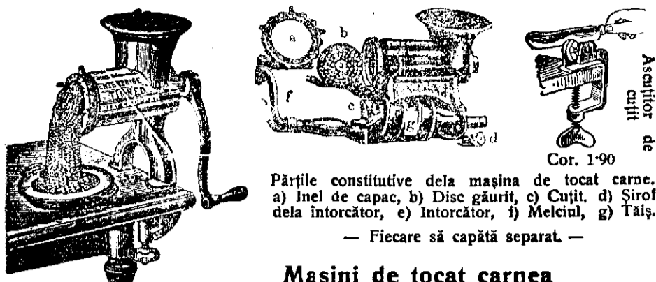
Părțile constitutive dela mașina de tocat carne. a) Inel de capac, b) Disc găurit, c) Cuțit, d) Șirof dela întorcător, e) Întorcător, f) Melciul, g) Tăiș. — Fiecare să capătă separat. —