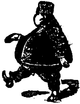
s'a Ingrășat de 120 Kigr.