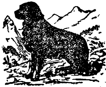
La „Cănele negru”.