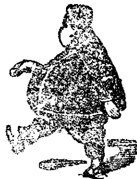
s'a Ingrășat de 120 Kigr.