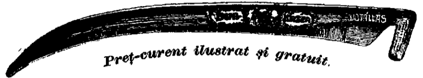
Preț-curent ilustrat și gratuit.

Coasa de oțel „Bur“ numai atunci este veritabilă, dacă pe mâner poartă gravată inscripția aceasta: W. G. Kőbánya , iar pe latul ei este tipăriă marca firmei cum arată figura asta: 190 5—20