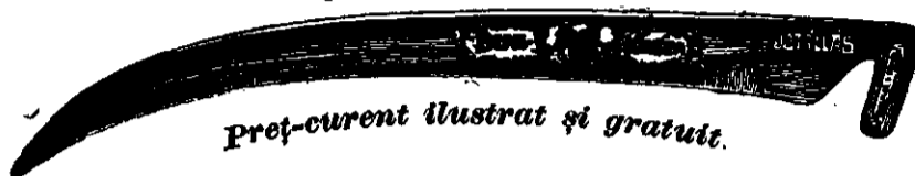
Preț-curent ilustrat și gratuit.

Coasa de oțel „Bur“ numai atunci este veritabilă, dacă pe mâner poartă gravată inscripția aceasta: W. G. Kőbánya , iar pe latul ei este tipărită marca firmei cum arată figura asta: 190 6—20